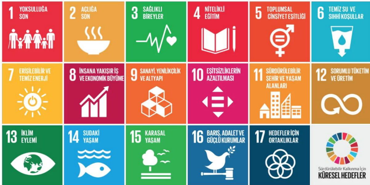
Şekil 1. Sürdürülebilir kalkınma amaçları

Bu kapsamda belirlenen 17 amaç aşağıdaki gibidir (United Nations, 2015):