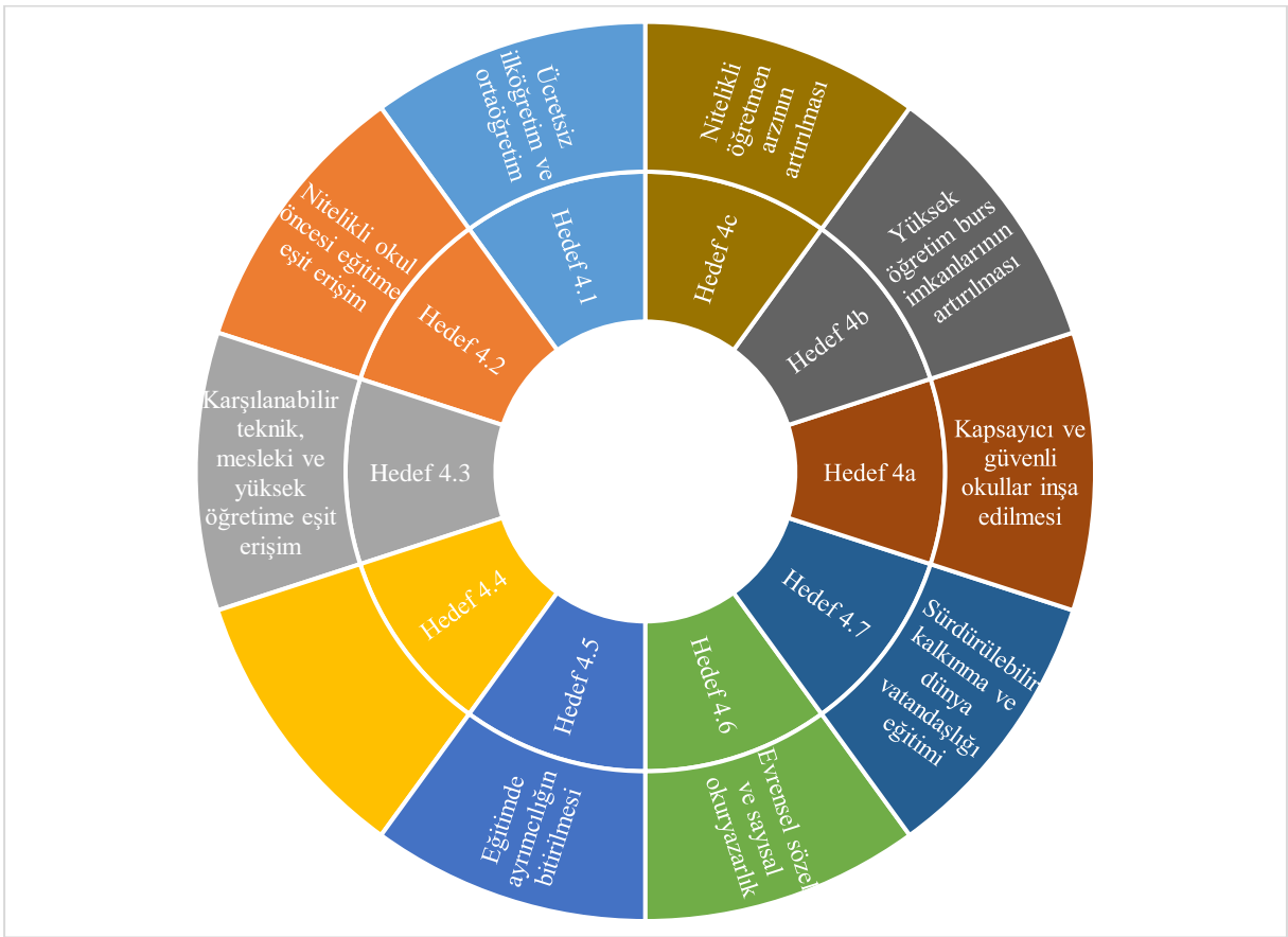
Grafik 1. Nitelikli eğitim amacına yönelik alt hedefler

Nitelikli eğitimde temel amaç, bireye kişilik kazandırarak hem bireyin hem de toplumun refahını en üst düzeye çıkarmaktır. Nitelikli ve yeterli iş gücünün yetiştirilmesinde, kaliteli eğitim kurumlarının rolünün büyük olduğu vurgulanmaktadır. İnsanlar nitelikli eğitime eriştiğinde, yoksulluk döngüsünden çıkabilirler. Bu nedenle eğitim, eşitsizliklerin azaltılması ve toplumsal cinsiyet eşitliğinin sağlanmasına da katkı sağlamaktadır ve bu sayede diğer SKA'lara ulaşmaya hizmet etmektedir. Aynı zamanda, insanların daha sağlıklı ve sürdürülebilir bir yaşama sahip olmalarına olanak tanır. Bunlara ek olarak nitelikli eğitim, insanlar arasında hoşgörünün artmasına ve barışçıl toplumların inşasına da destek olmaktadır (UNDP, 2020). Bu yüzden kapsayıcı, hakkaniyete dayanan ve herkes için yaşam boyu öğrenim fırsatlarını teşvik etmeyi hedefleyen nitelikli eğitim amacına yönelik alt hedefler belirlenmiş ve 2030 yılına kadar bu hedeflere ulaşılması amaçlanmıştır. Bu hedefler, eğitimde fırsat eşitliğini sağlamak, öğrenme kalitesini artırmak ve toplumsal kapsayıcılığı desteklemek gibi temel alanlarda somut ilerlemeler gösterebilmeyi hedeflemektedir. Nitelikli eğitim amacına yönelik bu 10 hedef grafikte sunulmuştur: