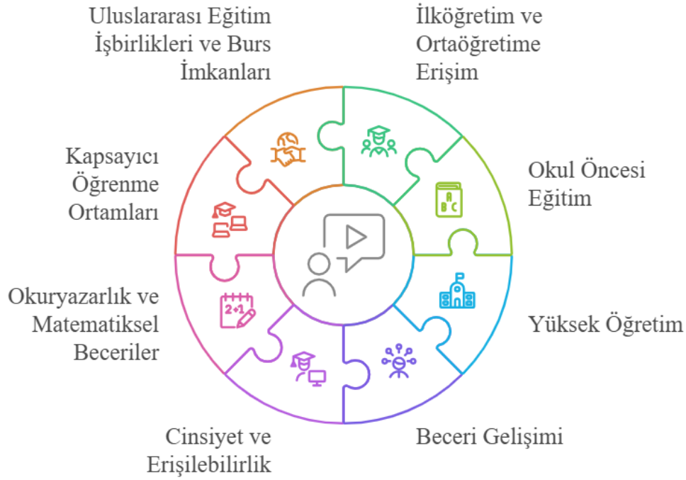
Grafik 2. Nitelikli eğitim hedeflerinin odak alanları

Grafik 2’de görüleceği üzere hedeflerin odaklandığı eğitim konuları birbiriyle ilişkilidir, bütünsel bir özellik taşımaktadır ve neredeyse eğitimi tüm yönleriyle kapsamaktadır. Her bir bileşen, nitelikli eğitim hedefinin farklı bir yönünü ele almaktadır. “Okul öncesi eğitim”, “ilköğretim ve ortaöğretime erişim”, ve “yüksek öğretim” alanları, eğitimin farklı kademelerine odaklanmaktadır. “Okuryazarlık ve matematiksel beceriler” ve “beceri gelişimi” bireylerin akademik yetkinliklerini ve insanın bir iş gücü unsuru olarak piyasanın ihtiyaç duyulan becerilerini geliştirmeye yönelik hedefleri yansıtmaktadır. “Cinsiyet ve erişilebilirlik” başlığı eğitimde toplumsal cinsiyet eşitliğini sağlama hedefini ve dezavantajlı ya da kırılgan grupların eğitime erişimini kolaylaştırmayı amaçlamaktadır. “Kapsayıcı öğrenme ortamları” güvenli, erişilebilir ve eşitlikçi eğitim ortamlarının oluşturulmasını hedeflemektedir.