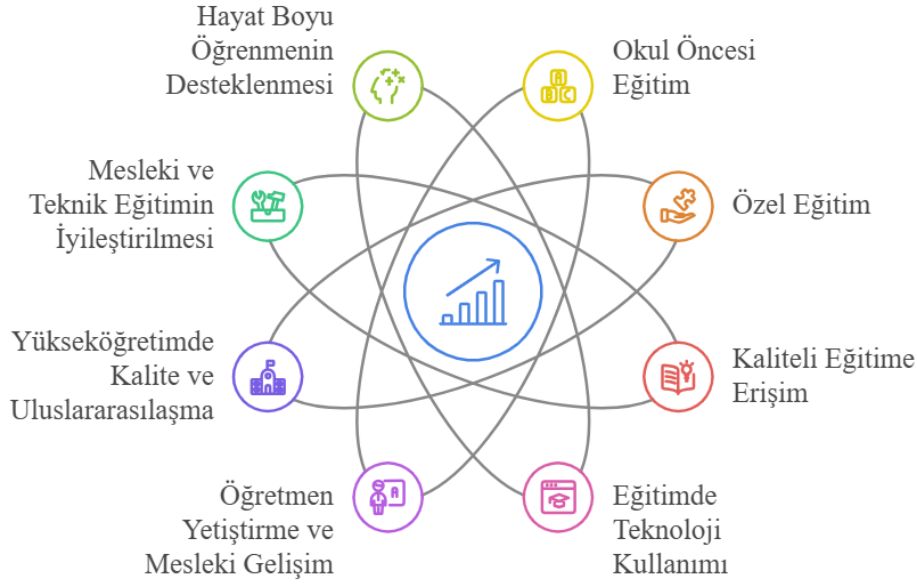
Grafik 3. On ikinci kalkınma planında eğitim politikalarının ve tedbirlerinin odak alanları

Grafik 3, 12. Kalkınma Planı çerçevesinde eğitim alanındaki temel odak alanlarının bir özeti niteliğindedir. Bu başlıklar kapsayıcı ve nitelikli bir eğitim yaklaşımını sağlama hedefini vurgulamaktadır. 12. Kalkınma planının eğitim hedeflerinde okul öncesi eğitimden başlayarak, kaliteli eğitime erişim, özel eğitim, öğretmen yetiştirme, mesleki ve teknik eğitimin iyileştirilmesi gibi alanlara vurgu yapılmaktadır. Ayrıca, eğitimde teknoloji kullanımı, hayat boyu öğrenme ve yükseköğretimde kalite ile uluslararasılaşma gibi alanlar, bireylerin bilgi ve beceri düzeylerini geliştirerek topluma katkı sağlayacak nitelikli insan gücünün yetiştirilmesini amaçlamaktadır. Bu hedef alanları incelendiğinde “SKA 4: Nitelikli Eğitim” hedefleriyle olan paralellik dikkat çekmektedir.